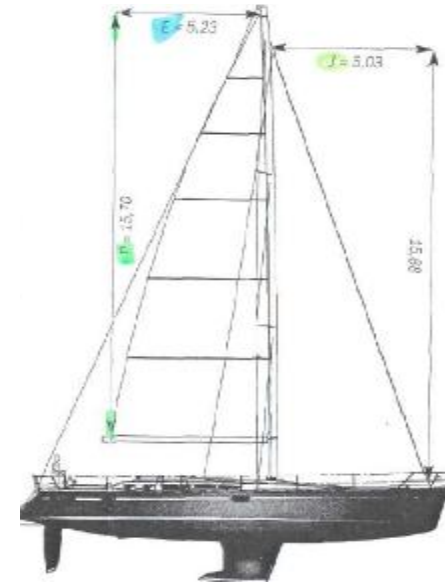
20-25 x LWL(12Mtr) -- daily run 240-250sm